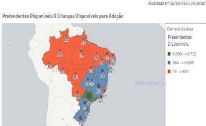
Figura 1 - Camada de área pretendente disponível