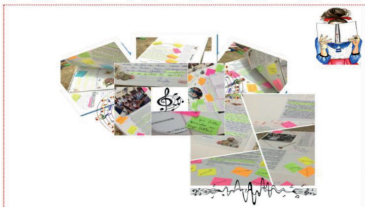
Figura 2 - Página do Caderno de partituras do trabalho docente

docente (inicial e continuada) possibilitadas a partir do encontro entre professora em exercício e graduandas do curso de Pedagogia, que participavam (como bolsistas) de um Projeto do Núcleo de Ensino (Pró-reitoria de Graduação/UNESP) em sala de aula. A professora, autora da tese, recebeu ao longo de três anos duas graduandas do referido curso, semanalmente, para juntas pensarem propostas de trabalho com os alunos que tinham como horizonte a literatura. Na pesquisa, a autora, frente a todo o material, corpus do trabalho, faz dois movimentos. Num primeiro momento apresenta a construção do documento que a autora chamou de “Caderno de partituras do trabalho docente”.