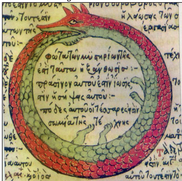
Figura 1 - Ouroboros

morde a própria cauda, simbolizando a evolução ao voltarmos-nos para nós mesmas.