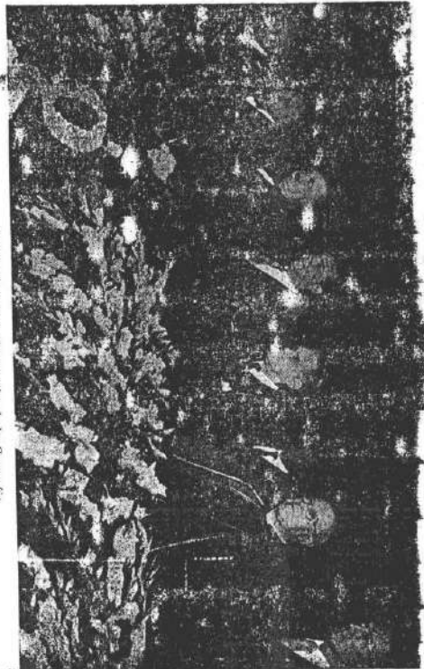
XVIII Congresso Internacional de Geografia (Texto na página 19)

A CAPES tem por fim a promoção de medidas destinadas ao aperfeiçoamento do ensino universitário e à melhoria, em qualidade e quantidade, do quadro de profissionais de nível superior do País.