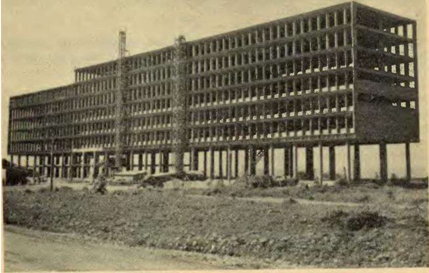
Faculdade Nacional de Arquitetura. (Construção)

1. 260 matrículas, cabendo a cada série 180 a 252 alunos, distribuídos em quatro turmas, as quais, por sua vez, para o ensino das cadeiras práticas, serão subdivididas em duas. A cada ano letivo corresponderá um pavimento, apresentando, todos, a mesma composição.