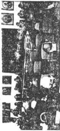
Aspecto da subordinação de carreiras no curso.