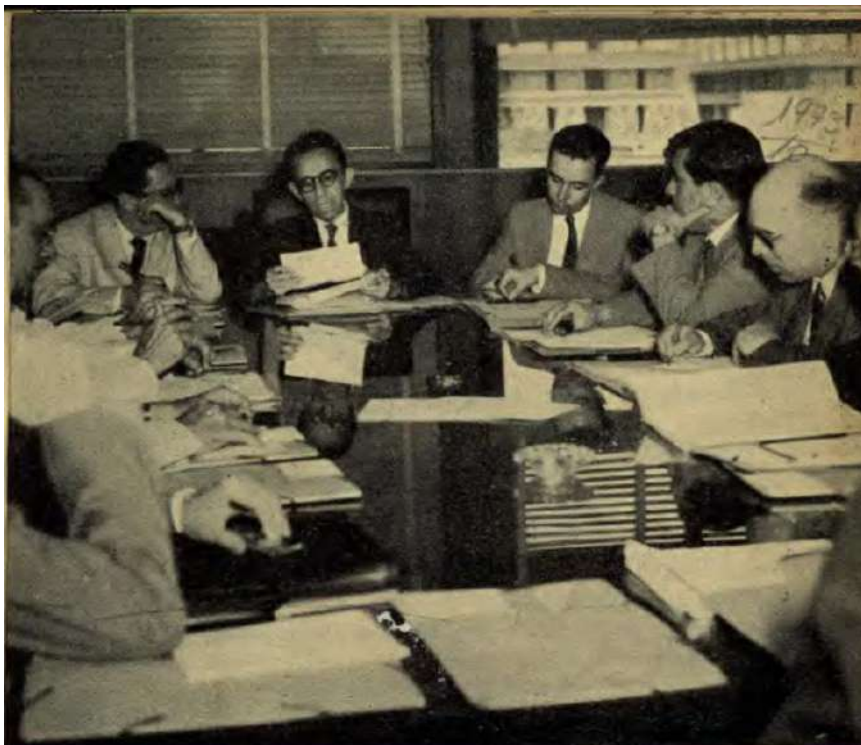
1 Reunião dos Diretores das Escolas de Engenharia (Texto na página 11)