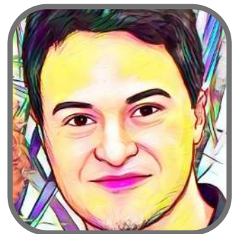
WAGNER PROFESSOR DE GEOGRAFIA