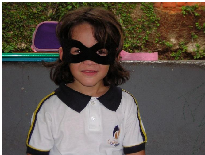
Imagem 9: Fantasia.

Nunca fui um grande entusiasta de fantasias. Elas me despertam sentimentos de preguiça (pensar um tema e planejar todo o disfarce) por causa das festas. Festas à fantasia são sempre ambientes desconfortáveis. Quando criança tinha meus heróis favoritos e, é claro, que eles eram as principais referências para o tão esperado dia da fantasia no colégio. Nos fantasiar, no ambiente escolar, era quase como um episódio comemorativo de qualquer série de televisão que nos vem à cabeça.