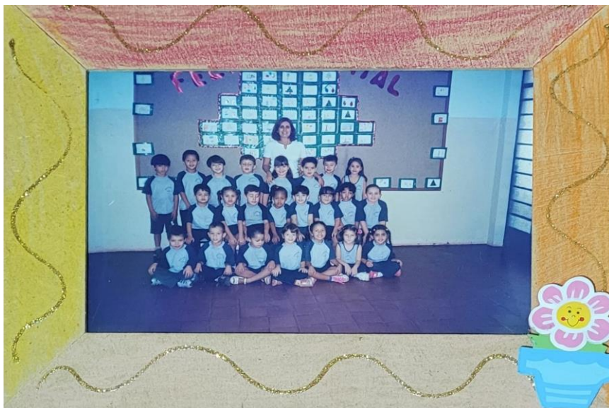
Imagem 8: A primeira turma.

Esta foi a minha primeira foto de turma. Eu estava muito ansiosa para saber como seria. Me lembro que também estava muito feliz pela minha franja nova, que estaria na foto. Tenho um sentimento bom, ao pensar, naquele ano escolar, sinto que foi um ano incrível. Eu descobri, naquela época, que gostava muito de ir para a escola e aprender coisas novas. Também me lembro do sentimento de tristeza, pois, no ano seguinte, teria que deixar a turma da professora Selma. Ou será Telma? Nunca sei ao certo a primeira letra do nome dela, já que sempre a chamava de "tia".