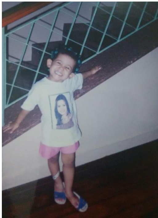
Imagem 1: Uma menina e uma casa.