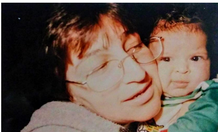
Imagem 10: Eu bebê.

As reflexões, aqui, tecidas são fruto de uma proposta de escrita narrativa que ocorreu em um dos encontros da disciplina eletiva “Documentação Narrativa de Experiências Pedagógicas”. A proposta era criar uma narrativa sobre alguma experiência marcante da nossa infância, relacionada a alguma fotografia ou objeto. Pode parecer uma tarefa fácil de se fazer, mas preciso declarar o meu incômodo com a proposta, que, em si, não tem nada de errada, mas, de encontro com a minha pessoa, gerou uma série de tremeliques e tornou essa tarefa mais desafiadora do que eu esperava. Por sorte, me lembrei da fala de um professor de física, saudoso mestre Dani, que, ao notar, nas nossas expressões faciais, tais tremeliques, frente aos problemas apresentados, logo soltava: “Começemos por partes!”. Então, vamos lá!