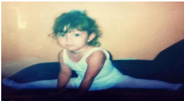
Imagem 5: A bailarina 1.

Eu gostava de colocar a roupinha de ballet e ficar dançando pela casa o clássico "essa menina tão pequenina quer ser bailarina", de Cecília Meirelles, imaginando que estava em um palco, que era a primeira bailarina, muito famosa, muito bonita, que encantava a plateia com meus movimentos leves e graciosos. Provavelmente, só ficava pulando igual a uma cabrita pela casa! Naquele dia, o sofá e o banquinho eram meus objetos de cena, eu os usava como parte das minhas complexas coreografias: subia, fazia pose, pulava, qualquer coisa, menos o jeito tradicional de se usar um sofá. No meio da apresentação, minha tia Maria, a quem eu carinhosamente chamo, até hoje, de "titia", chegou na sala, o que significava mais plateia, então, claro, que não interrompi o ato, afinal, o show tem que continuar.