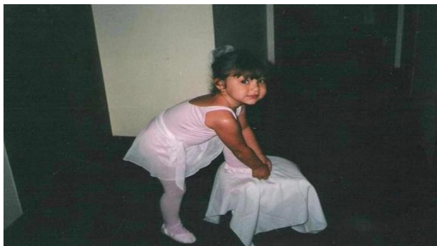
Imagem 4: Menina-artista.

Eu não sou boa em me lembrar do ano em que minhas memórias da infância aconteceram ou quantos anos eu tinha em cada uma delas. A verdade é que minhas memórias de infância não são muito claras, no geral, mas são boas. Muitas vezes, vejo uma fotografia, mas não me lembro do instante em que ela foi tirada, mas essas, em específico, por algum motivo, eu me recordo exatamente do momento.