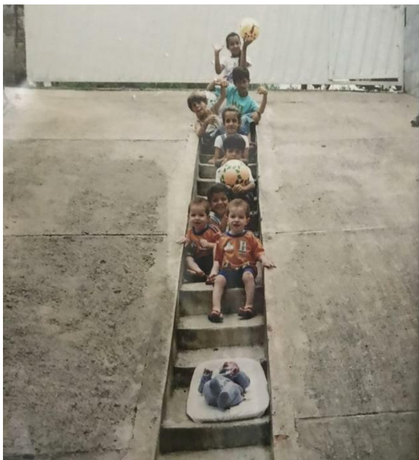
Imagem 2: Irmãos.