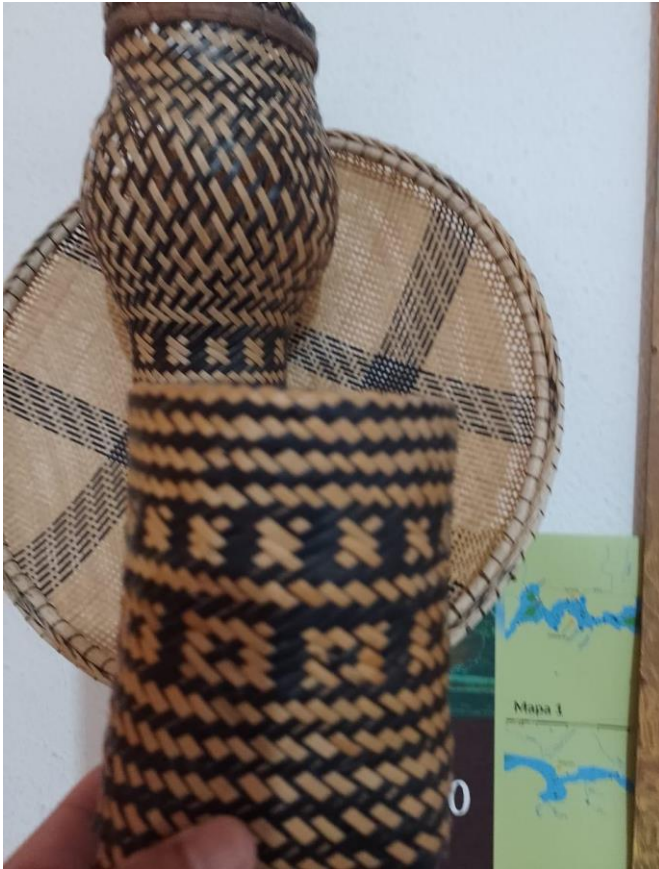
Imagem 3: Urutu, cesta confeccionada com fibras de Arumã.

Eu me lembro de como era a vida na minha comunidade, como se fosse hoje. Até então, logo após voltar da aula, estive comentando com a minha colega que, a essa hora, a minha mãe deveria estar voltando da roça, e meu pai, da escola, na qual ele trabalha. É uma saudade a qual me faz lembrar dos momentos em