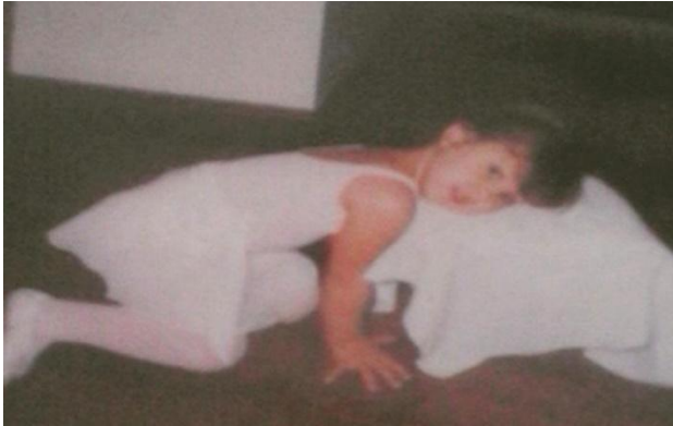
Imagem 7: A bailarina 3.

Imagino que minha tia tenha achado a cena digna de ser lembrada, pois pegou sua máquina e fotografou várias das minhas poses, que, na minha cabeça, eram elaboradas e geniais. Fico muito feliz que titia tenha decidido registrar aquela performance, porque nunca me esqueci dessa sessão de fotos e essas imagens são, até hoje, muito importantes para mim.