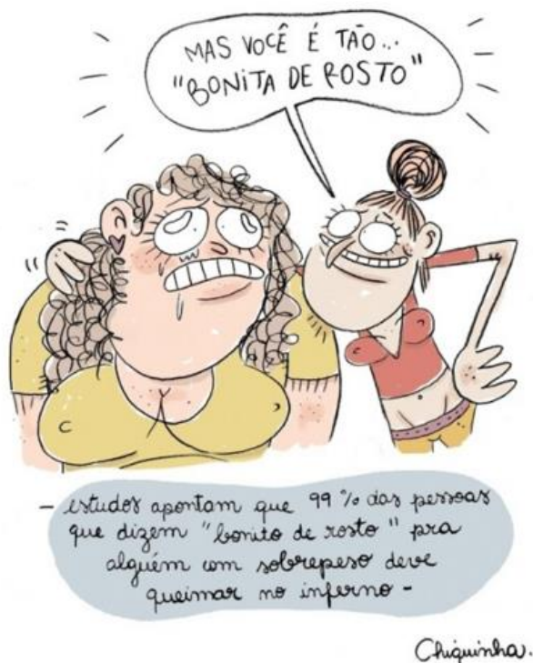
Figura 1 - Gordofobia

Trazemos aqui algumas propostas que foram desenvolvidas, porém ainda não aplicadas, aos alunos do 9º ano do Ensino Fundamental de uma escola pública estadual no interior do Espírito Santo. A instituição está situada no município de Rio Novo do Sul. As tirinhas exploradas, todas elas, são bastante provocativas no que tange a questões de gênero, tendo a mulher como protagonista, seja em situações positivas, que falam do empoderamento atual do sexo feminino, seja em situações negativas, como um episódio de violência doméstica. São temáticas contemporâneas, muito discutidas nos circuitos social e acadêmico, também nas rodas de amigas, nos coletivos feministas, nas redes sociais; enfim, em muitos espaços, de maior ou de menor formalidade. As pautas em jogo são muito bem-vindas e trazem em seu bojo discussões importantes, como a gordofobia, por exemplo.