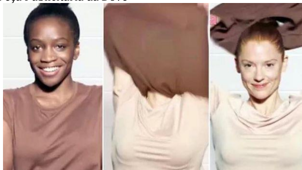
Figura 4 - Peça Publicitária da Dove