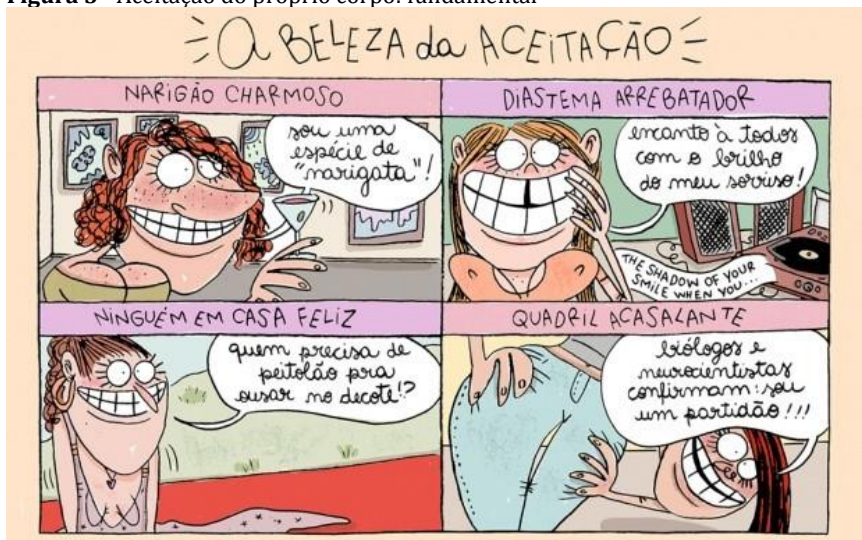
Figura 3 - Aceitação do próprio corpo: fundamental

Nesse texto, as personagens representam perfis de mulher que tem características passíveis de “críticas” no olhar maldoso de outrem. O nariz mais protuberante, que para muitos é defeito imperdoável, devendo ser corrigido via cirurgia plástica, torna-se um motivo de orgulho para sua dona; o diastema, pequena falha entre os dentes frontais, torna-se o charme da garota que não deixa de sorrir ou de se alegrar; a moça de seios pequenos usa decotes e valoriza sua “casa vazia”; a garota do quadril largo, “acasalante”, mostra suas curvas sem a menor vergonha de ser feliz. As quatro situações demonstram o empoderamento dessas mulheres que, a despeito de padrões estéticos impostos socialmente, souberam enxergar o belo do próprio corpo, sem a poluição dos filtros de preconceito. É possível ser feliz com o que se tem quando realmente nos aceitamos. Esse é o discurso motivador de “A beleza da aceitação”.