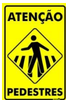
Figura 6 - Placas de Trânsito