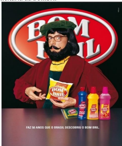
Figura 3 - Peça Publicitária da Bombril