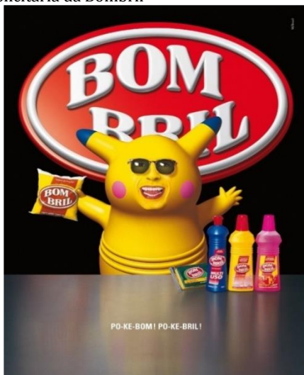
Figura 2 – Peça Publicitária da Bombril