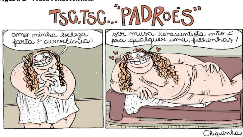
Figura 2 - Musa renascentista

Ainda discutindo a gordofobia, teremos um segundo quadrinho. A partir desses dois textos verbo-visuais, buscaremos estabelecer relações de intertextualidade – temática, discursiva, estilística –, além, é claro, de buscar também os aspectos não dialógicos suscitados pelo tema, uma vez que os ideais estéticos sofreram alterações sensíveis do Renascimento até a contemporaneidade. Para os greco-latinos, as curvas representam beleza, fertilidade e, portanto, as camadas adiposas poderiam conferir às moças um atrativo a mais na conquista. Visão bem destoante da contemporânea, na qual temos uma ditadura da magreza, corpos magros nas passarelas, nas novelas, nos veículos de comunicação, nos programas de televisão.