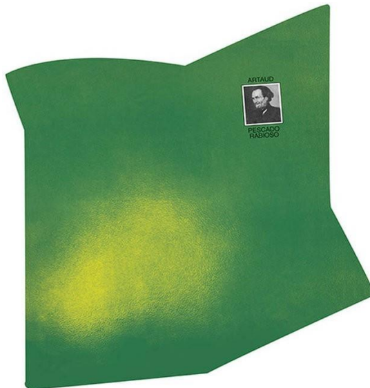
Figura 1 - Capa do disco Artaud (1973).

A narrativa foi feita durante a exposição Contraluz , realizada pelo artista plástico Juan Gatti, em Madri. Antes de se converter em um dos principais parceiros gráficos do cineasta Pedro Almodóvar, Gatti foi o responsável por diversas capas de discos de rock argentino dos anos 70, entre as quais se destaca a “estrela solitária” de Luis Alberto Spinetta, que podemos visualizar na imagem abaixo.