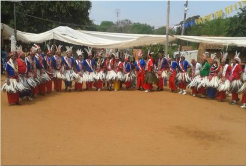
Imagen 3 - Danza ritual