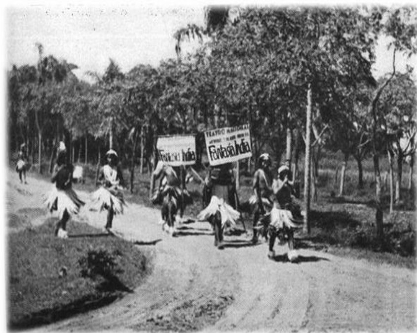
Imagen 3 - promocionando a “Fantasía India”