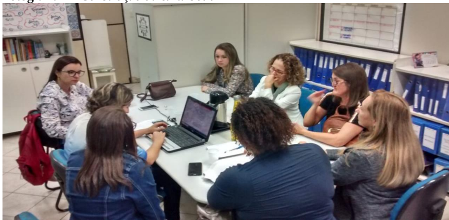
Fotografia 1 – Construção da carta Sedu

Assim, a carta foi construída de forma colaborativa, com estudos, contando com a parceria dos professores da Universidade Federal do Espírito Santo para sua finalização, conforme retratado na fotografia 1.